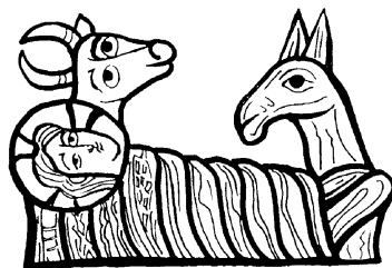
El Bou i la Mula