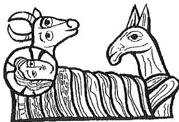
El Bou i la Mula